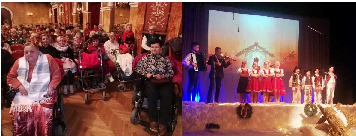
Mikulášske posedenie 17.12