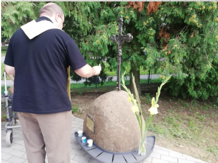
Vysvetenie pietneho miesta.