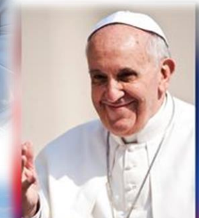
Návšteva Svätého Otca Františka v Prešove 14. september 2021