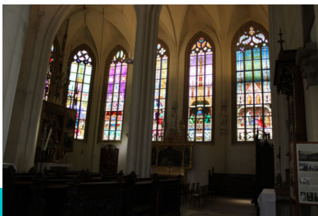
Ťažko bolo odtrhnúť oči od okien s farebnými vitrážkami, ktoré boli privezené až z Innsbrucku a na niektorých sú znázornené výjavy zo života sv. Martina či biblické motívy zo Starého a Nového zákona.

Toto výnimočné miesto očarilo nielen svojou chrámovou architektúrou, ale napríklad aj barokovými lavicami zo 17. storočia, na ktorých sú vyobrazené výjavy: Narodenie Ježiša, Klaňanie troch kráľov, Útek sv. rodiny do Egypta apod.