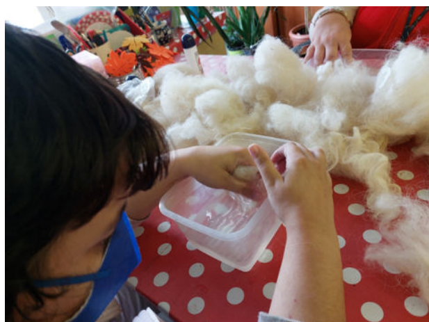
Foto č. 3 - Detailné čistenie ovčej vlny, tesne pred vyčesávaním

Prijímatelia, ktorí si budú chcieť pocvičiť jemnú motoriku si pri tomto prídu na svoje. Vlna sa perie vo vlažnej vode, už príjemne vonia, je nežná na dotyk. Jednotlivé chumáče sa jemne rozt'ahujú a vo vode ostávajú kúsky sena z letnej lúky či semienka tráv.