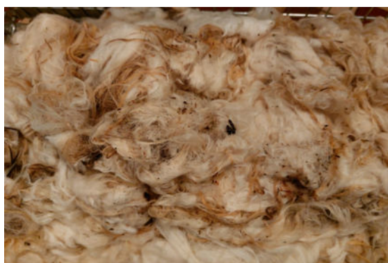
Foto č. 1 - Surová ovčia vlna, priamo po strihaní

Surovú ovčiu vlnu sme dostali ako sponzorský dar, priamo od baču z jedného spišského salaša. Je z ovečiek merino a valaška. Prvotné pranie nie je nijako vábna či voňavá záležitosť, ale... každopádne voda z vypratej vlny je vzácne hnojivo, po ktorom túži nejednen záhradkár.