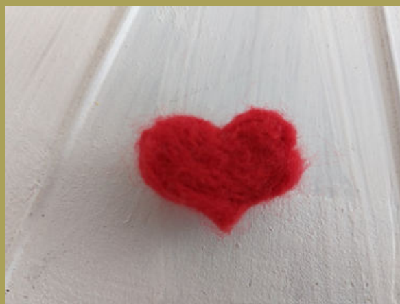
Foto č. 8 - Srdce - ľahučké ako pierko

Takéto ale aj rôzne iné podoby môže mať ovčia vlna. Je to famózný prírodný materiál, ktorý si zaslúži našu pozornosť a čas. V našom zariadení ho našťastie máme dostatok a máme aj zručné inštruktorky sociálnej rehabilitácie, ktoré Vám s touto aktivitou rady pomôžu.