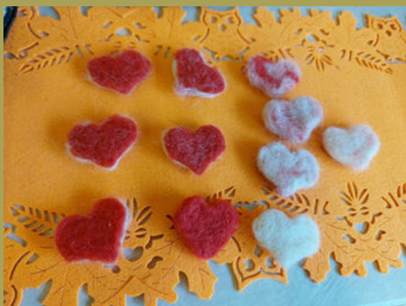
Foto č. 7 - Hotové uplstené srdiečka