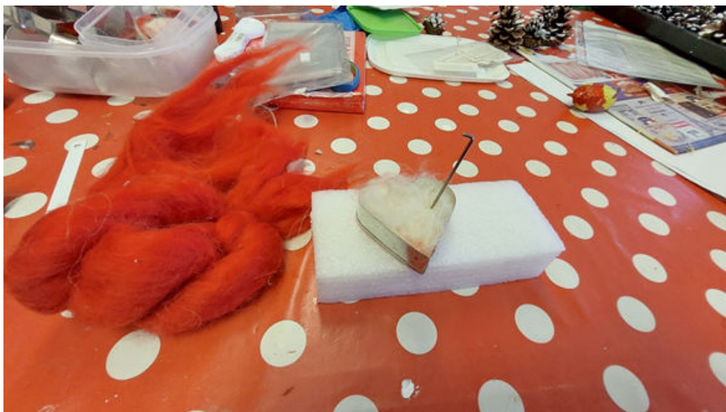
Foto č. 6 - Suché plstenie

Vyčesávanie ovčej vlny. Jedna z najpríjemnejších prác pri ručnom spracovaní vlny. Je tu potrebná aj mužská sila, ale pre výsledok sú rozhodujúce aj detaily a tu nič nežné ženské ruky nenahradí.