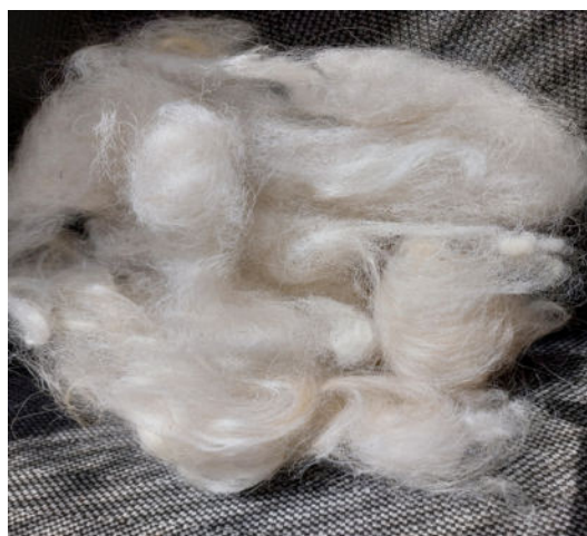
Foto č.2 - Vypratá ovčia vlna

Toto už je „iné kafé“, alebo skôr iná vlna. Je vypratá. Presne 10 x vypratá v studenej vode a pripravená na ďalšie spracovanie. Prišla o svoju „vôňu“, ale to sme jej radi odpustili.